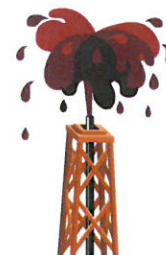
Productos del Petróleo