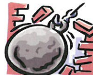
Escombros de Demolición

Los materiales que se muestran anteriormente producen humo tóxico cuando se queman. Respirar este humo puede ser dañino para su salud. En algunas áreas de Washington, toda quema al aire libre está prohibida. Vea la parte de atrás de este boletín para obtener más información.