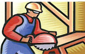
Desechos de Construcción